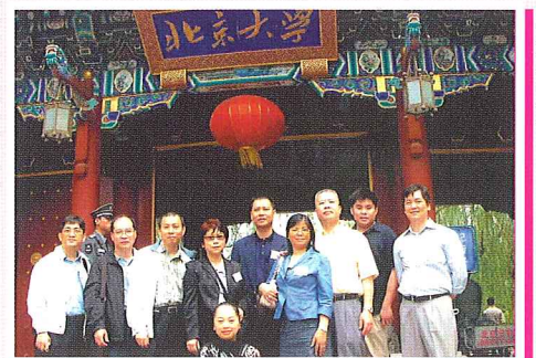
我們的新同學於北京大學門前留影