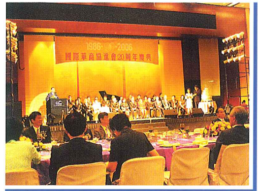
國際華商協進會20週年慶典會場