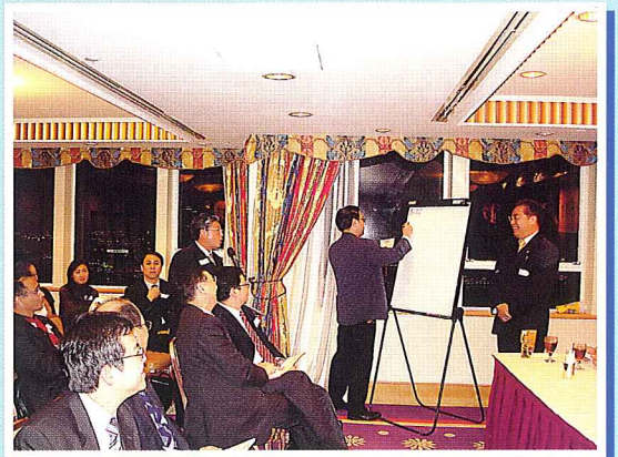
同學闡述其參選目的及抱負