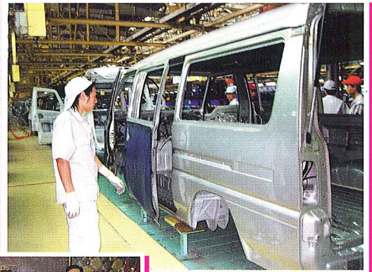
東南汽車集團的自動化生產工場