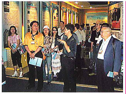
參觀福建榕基軟件開發公司