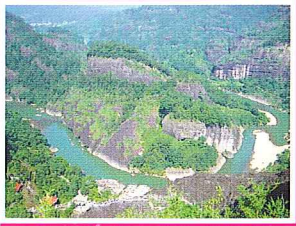
武夷山好山好水好風景