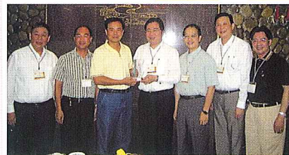
同學會向武夷山市市長胡書仁致送紀念品